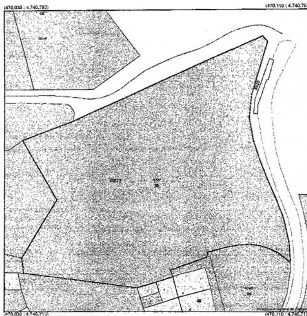
Proyección: U.T.M. Huso: 30.

Oficina Virtual del Catastro. Cartografía Catastral de Urbana. Provincia de Burgos. Municipio de Trespaderne. Dirección: C/ San Juan (Santotis) 5925(R) Suelo. Referencia catastral: 0007903VN7400N0001UR.